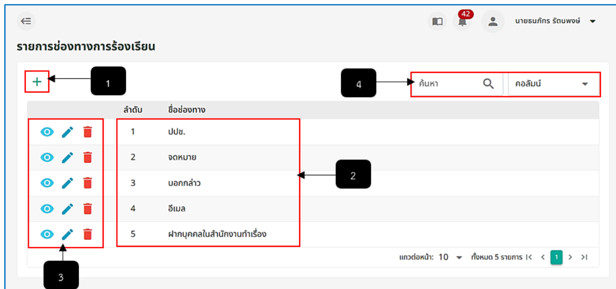
รูปภาพที่ 17 – 36 รายการช่องทางการร้องเรียน

หมายเลข 1 ปุ่มสำหรับคลิกเพื่อเพิ่มรายการช่องทางการร้องเรียน