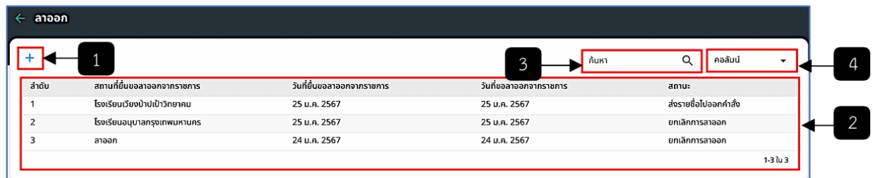
รูปภาพที่ 12 - 2 หน้าเรื่องขอโอน